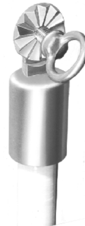
Codet EDF 37 12 361

This rope knife cuts everything from the finest bonds to conductor cables of 100 mm 2 as well as the rings of all dead-end clamps.