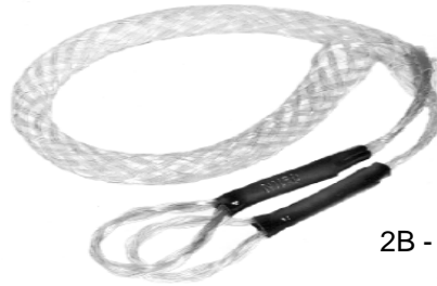
2B - 40/4